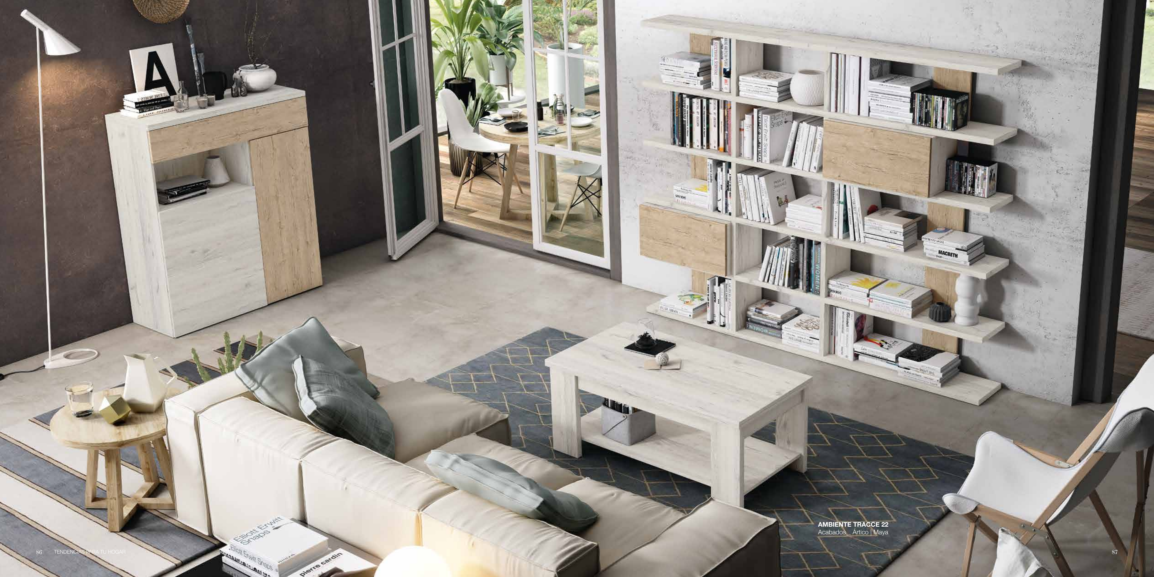
AMBIENTE TRACCE 22 Acabados: Artico | Maya