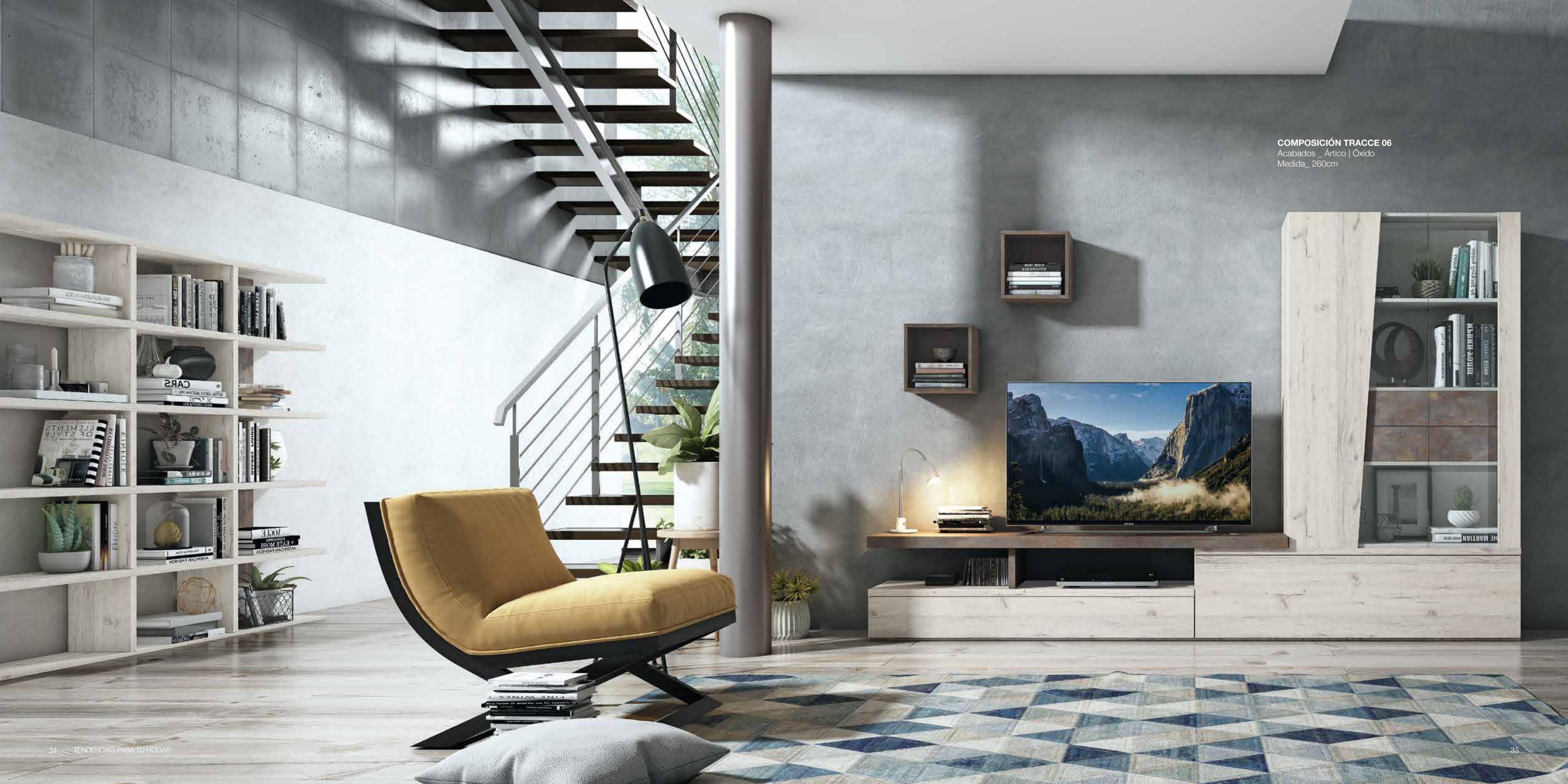
COMPOSICIÓN TRACCE 06 Acabados_ Artico | Oxido Medida_ 260cm