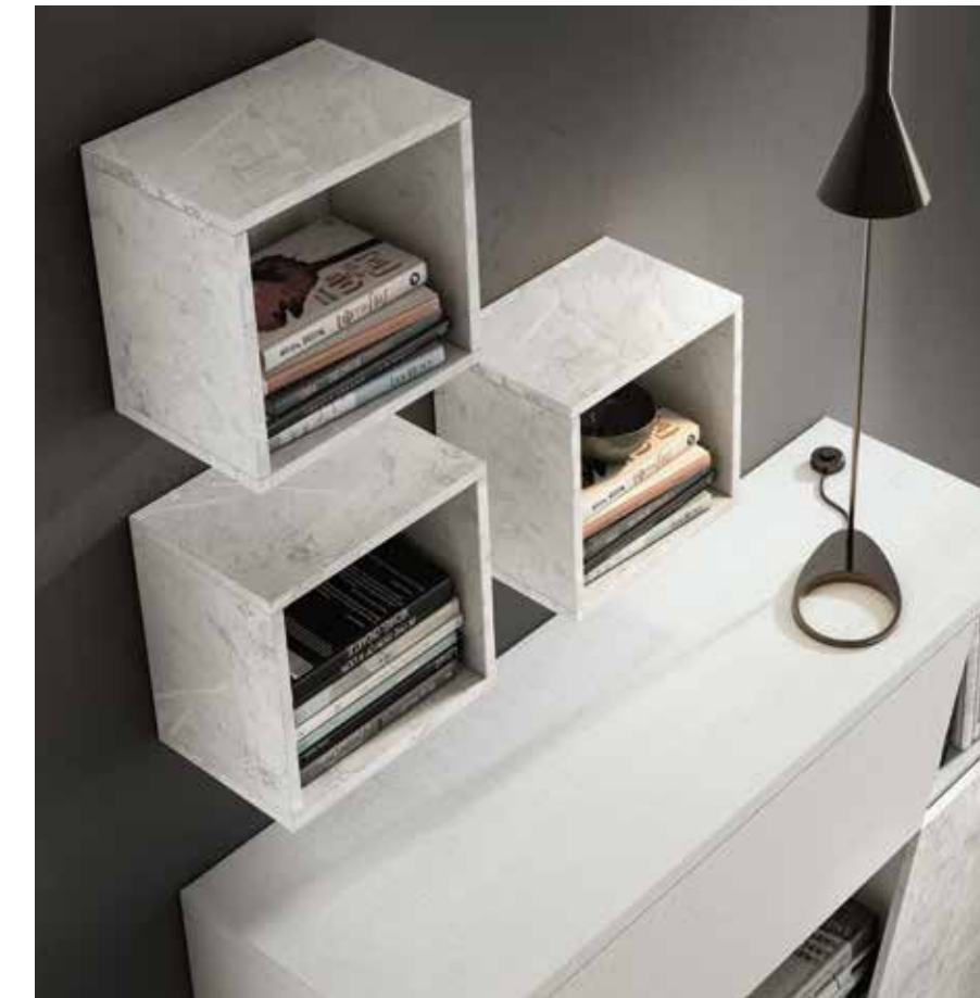
APARADOR GIRO 120 Acabados_ Blanco | Mármol Medidas_ 120 cm