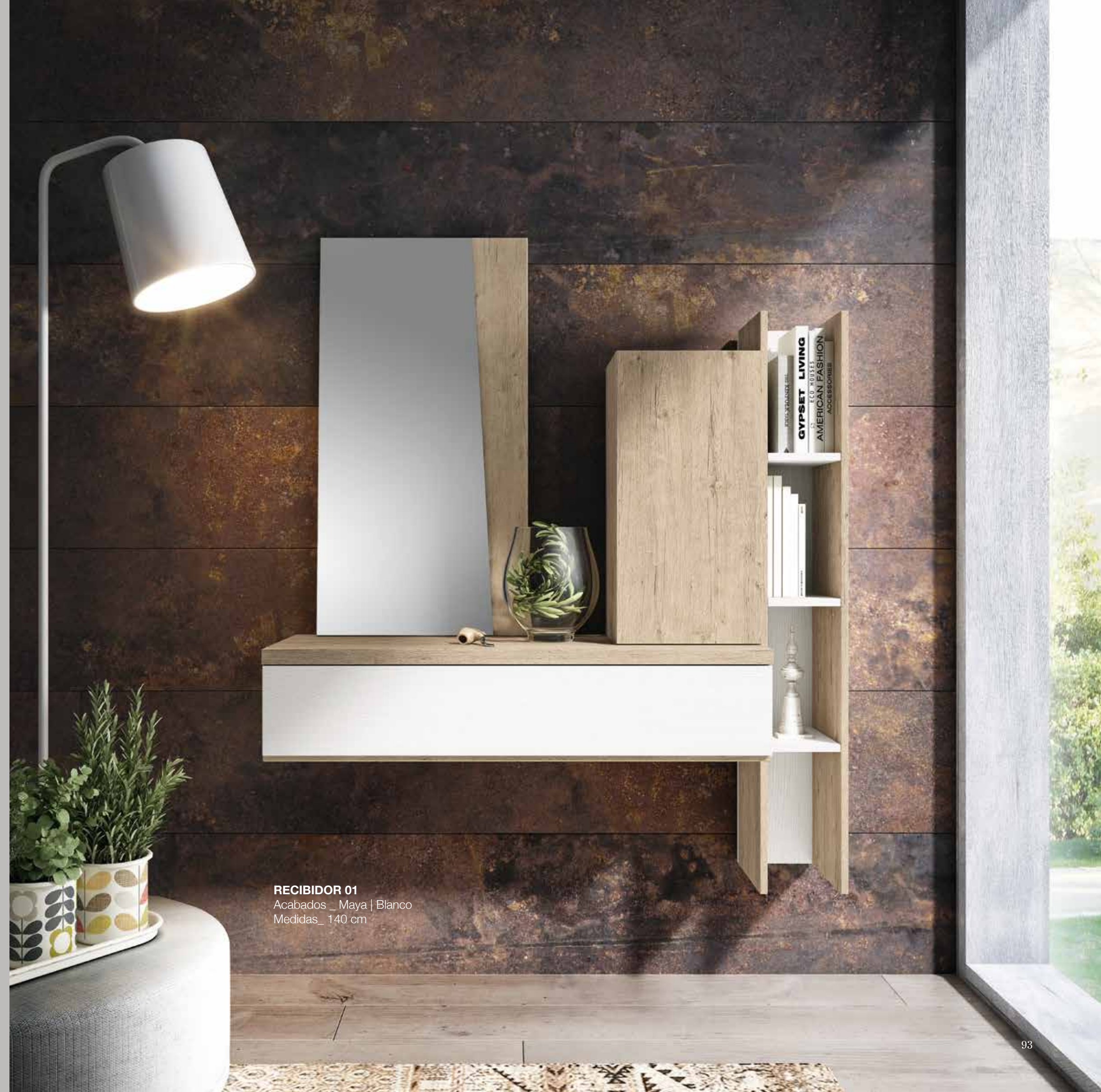
RECIBIDOR 01 Acabados _ Maya | Blanco Medidas_ 140 cm