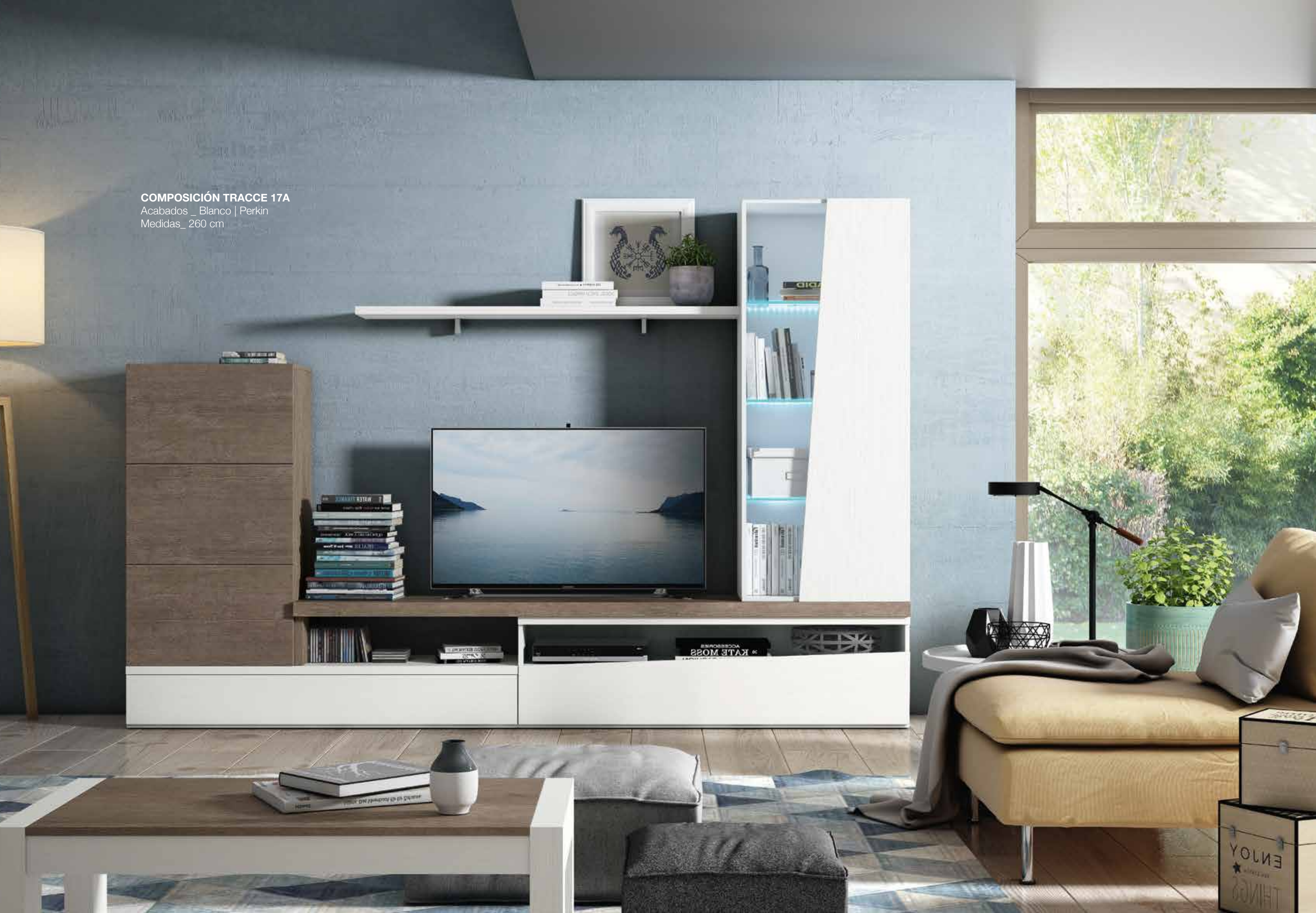
COMPOSICIÓN TRACCE 17A Acabados _ Blanco | Perkin Medidas_ 260 cm