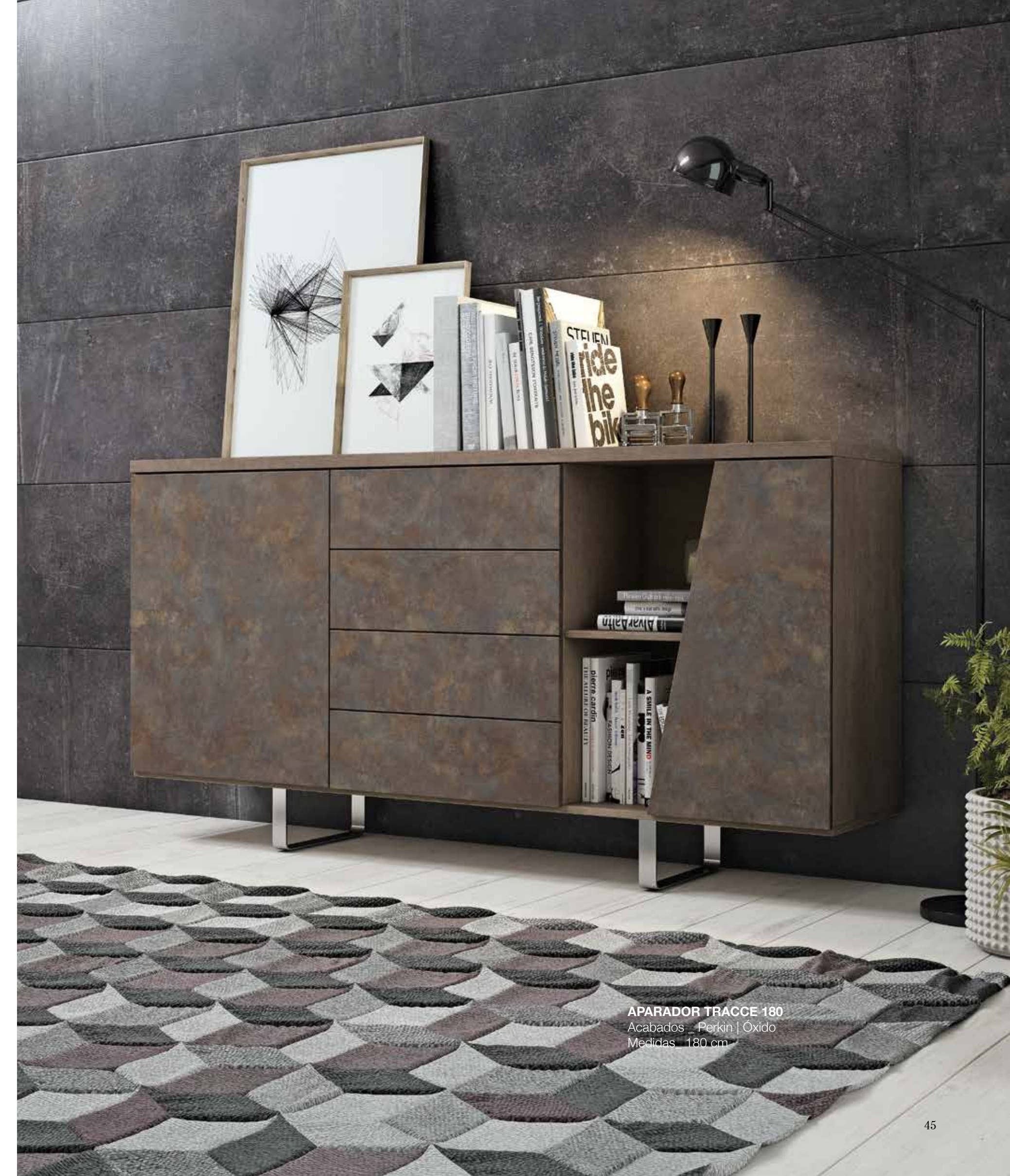
APARADOR TRACCE 180 Acabados _ Perkin | Óxido Medidas _ 180 cm