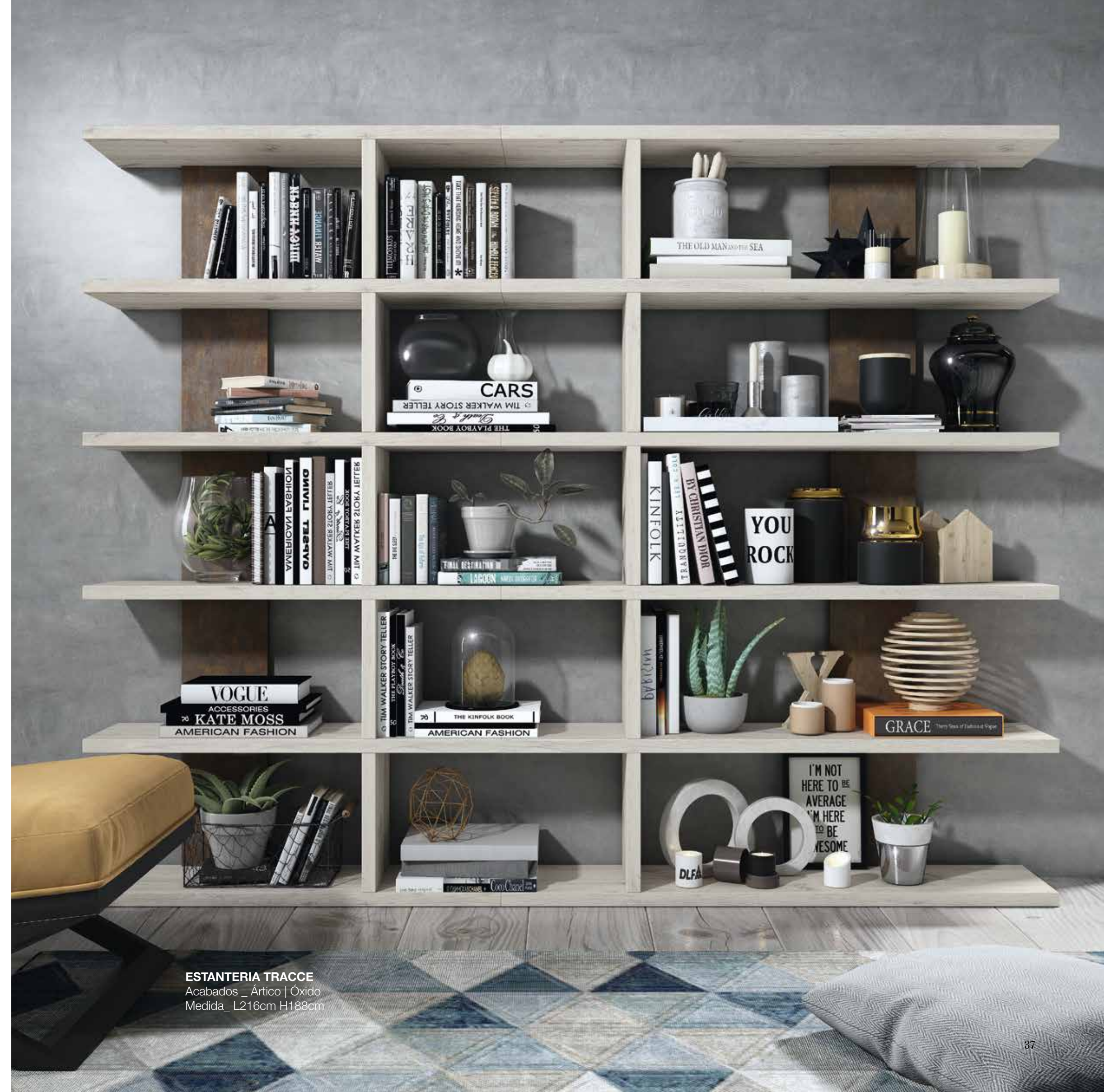
ESTANTERIA TRACCE Acabados _ Artico | Óxido Medida_ L216cm H188cm

2 glass doors cabinet detail with indoor drawers, showing a huge storage capacity. Employ textures and strong colours to create a library atmosphere.