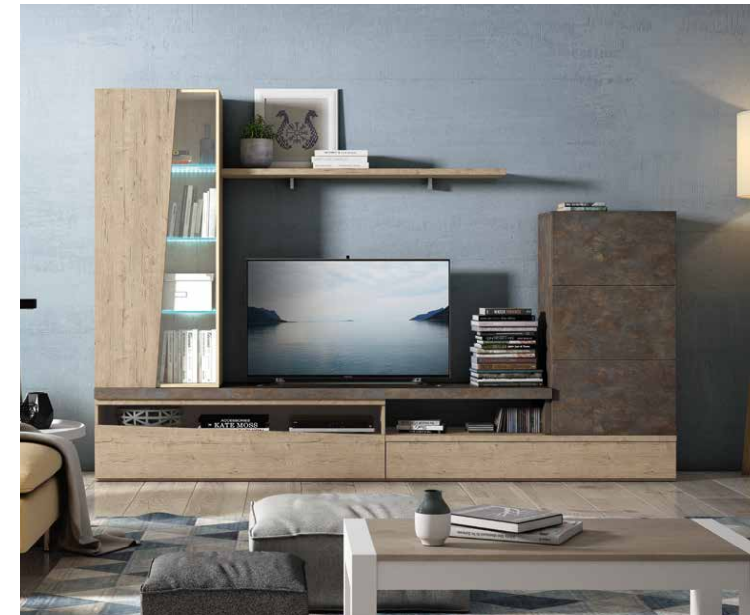
COMPOSICIÓN TRACCE 17B Acabados _ Maya | Óxido Medidas_ 260 cm

No necesitas ser decorador para crear composiciones agradables, sólo necesitas distribuir los módulos de la mejor manera que te interese y se adapte a tu salón. Combina los colores de paredes o texturas con los diseños de la colección TRACCE, acomódate y disfruta.