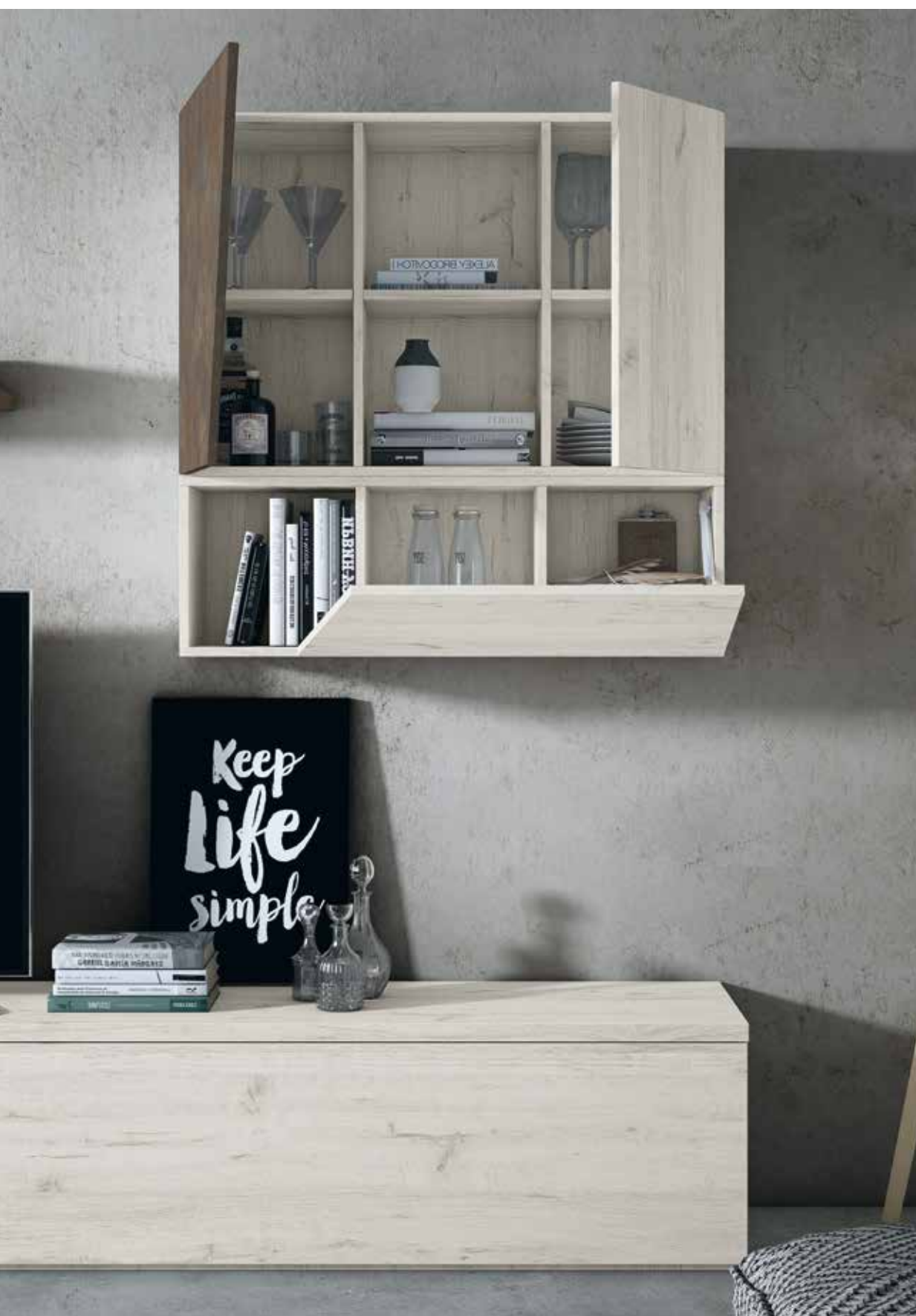
Detalle de módulo para colgar con puertas abiertas, donde podemos ver el espacio interior.