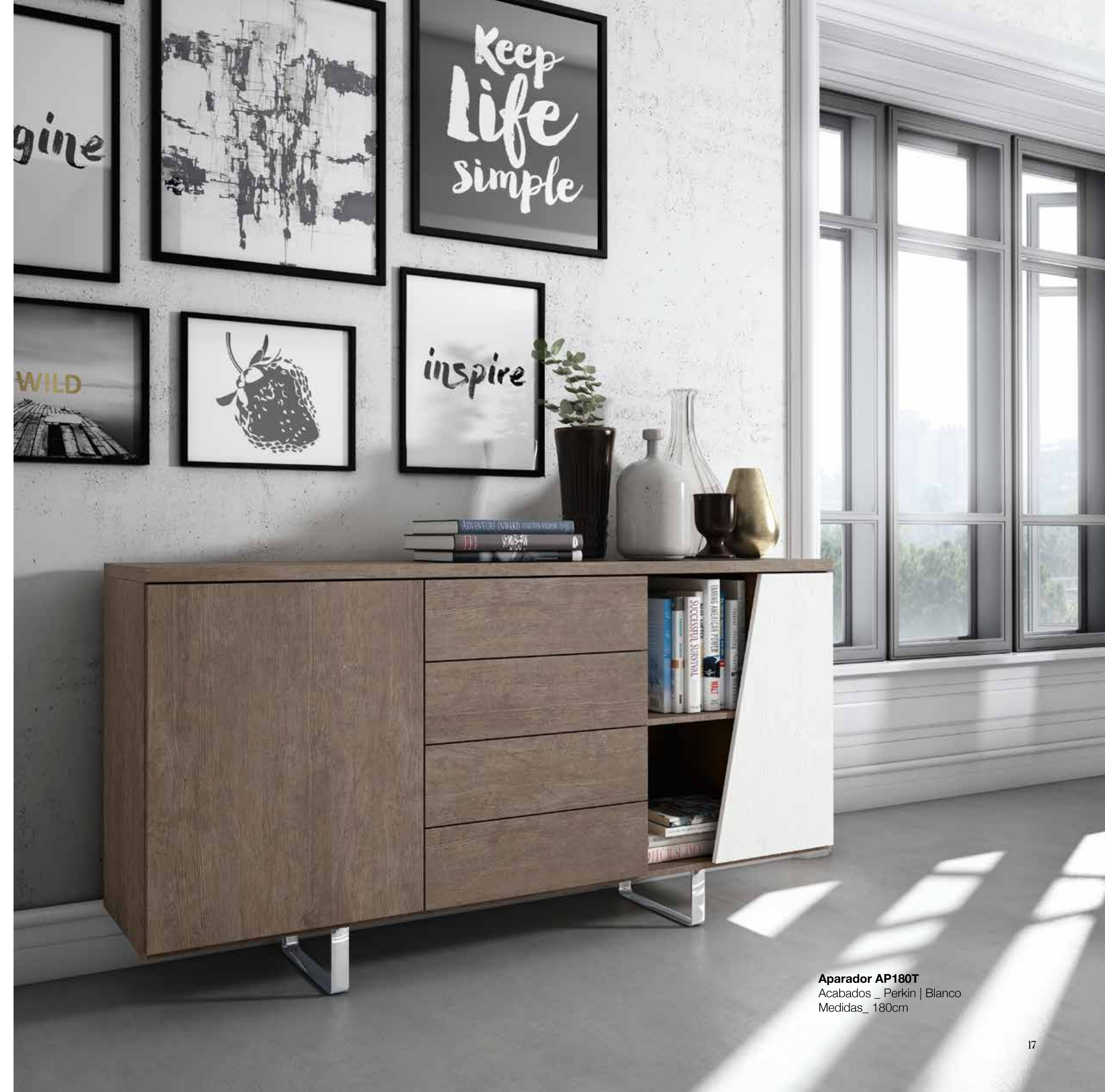
Aparador AP180T Acabados_ Perkin | Blanco Medidas_ 180cm

Angles furniture and diagonal doors make this model a piece at the vanguard with a contemporary design. New technologies to decorate your home.