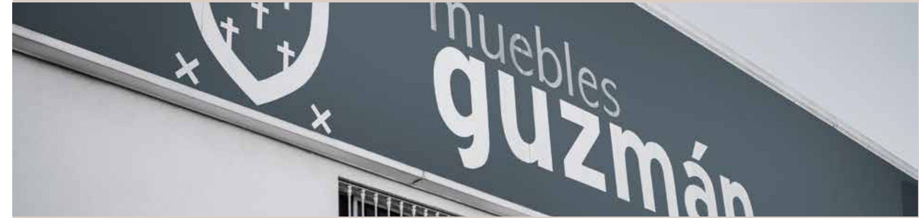
Vista principal de Muebles Guzmán. Modernas instalaciones con más de 8000 m2

Tras 12 años de constante crecimiento, en 1974 la empresa se traslada a unas instalaciones de 600m2 donde comienza la industrialización de su producción, incrementando sus posibilidades y creando una línea de muebles acorde a las necesidades del sector en aquella época. Pero no es hasta 1986, cuando Muebles Guzmán se consolida como una gran empresa del mueble instalándose definitivamente en el polígono industrial de Mancha Real con unas instalaciones propias de más de 2000 m2 dedicadas totalmente al diseño y fabricación del mueble del hogar, especializándose en salones y dormitorios.