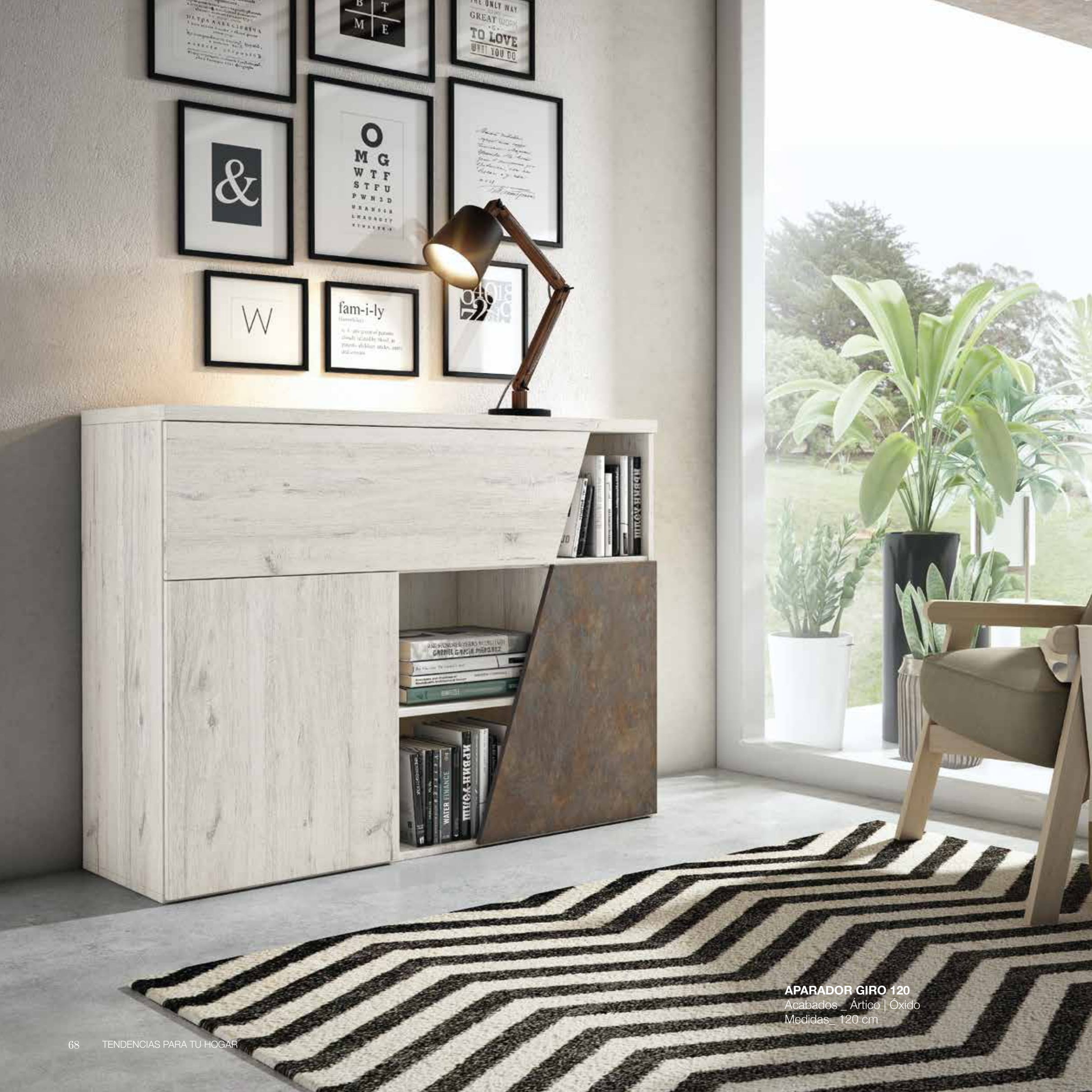
APARADOR GIRO 120 Acabados_ Ártico | Óxido Medidas_ 120 cm