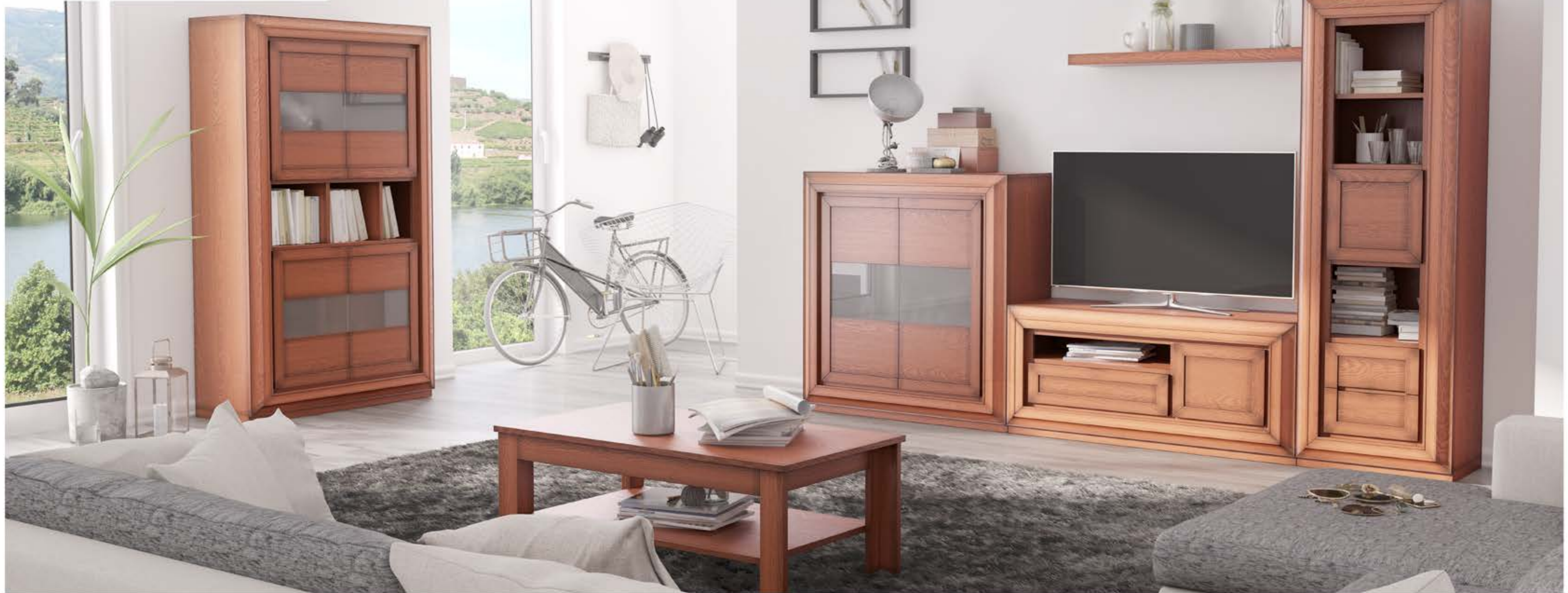
COMPOSICIÓN 42 CM FONDO